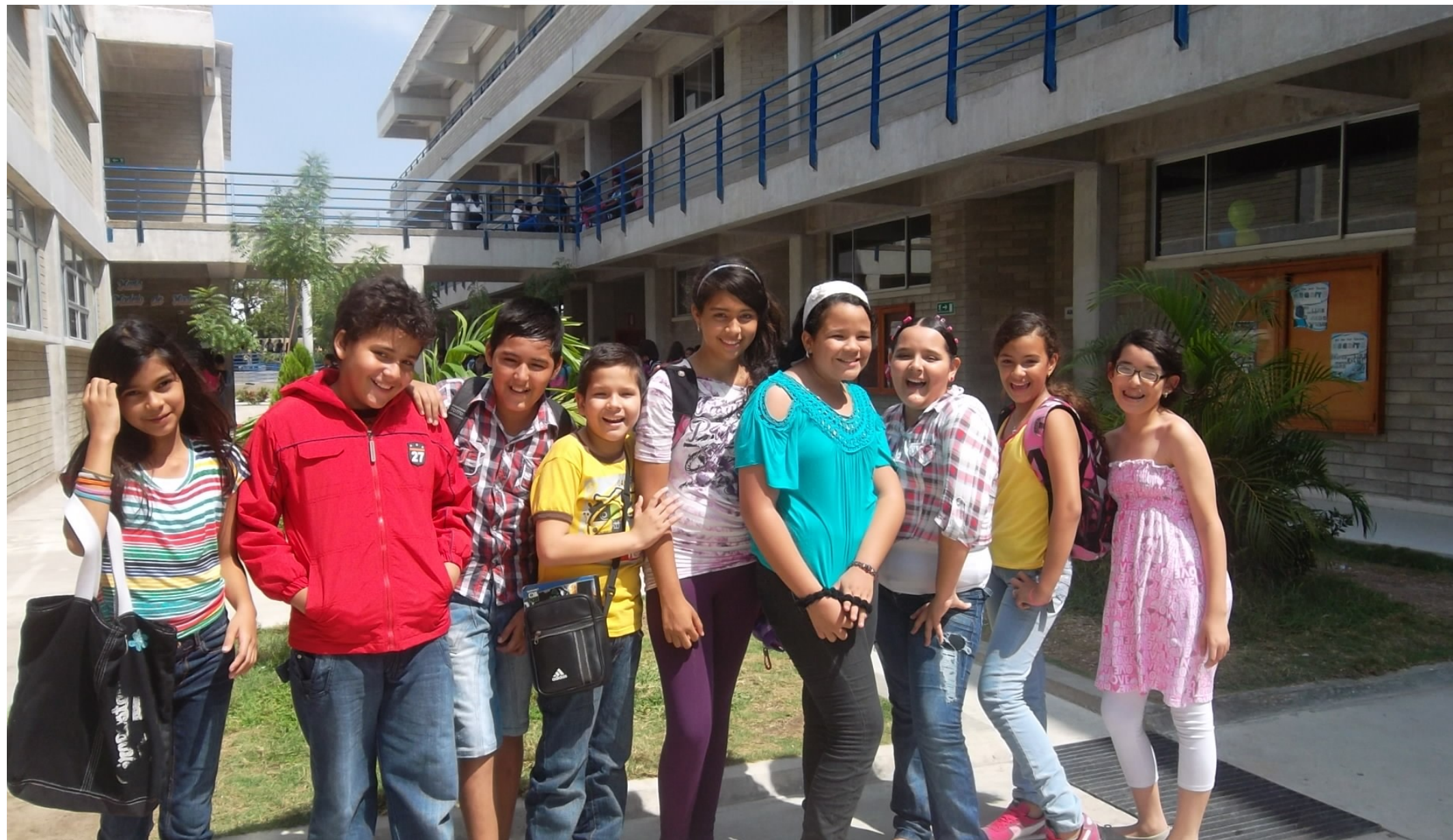
PROYECTO DEMOCRACIA EN LA WEB INSTITUCIONAL